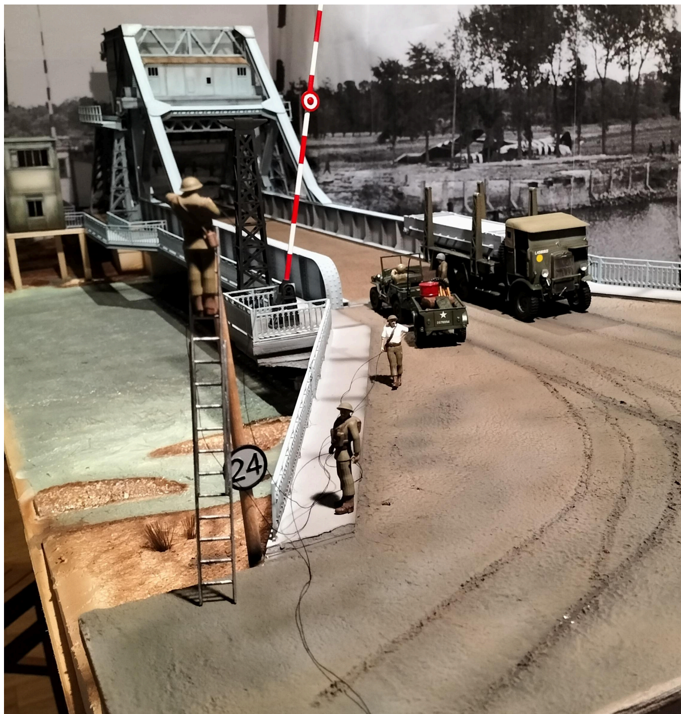
Photo couleur de la maquette