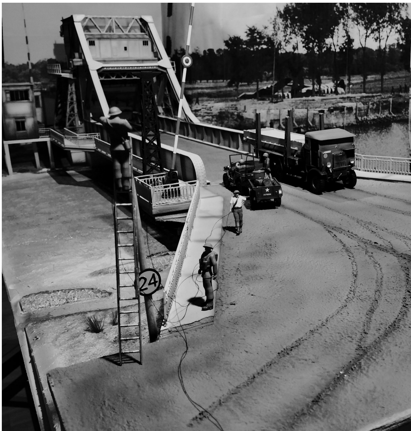
Photo noir & blanc de la maquette